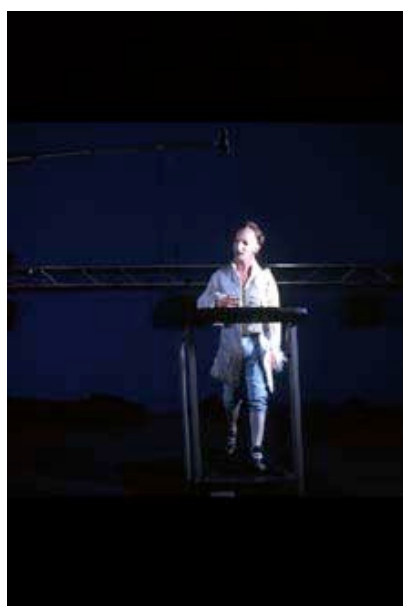
Tournage au Studio National du Fresnoy, 29 avril 1999.

Ragtime: mot américain de rag "chiffon" et time "temps". Musique syncopée et rapide.