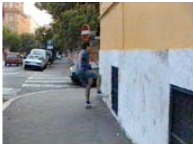
Le coup de pied dans le mur de L'homme du Pincio, une vidéo d'Alain Fleisher.

“Marche depuis longtemps déjà. A marché. A beaucoup marché. S'impatiente d'arriver parce qu'il a beaucoup marché.” Histoire du soldat, Ramuz - Stravinsky.