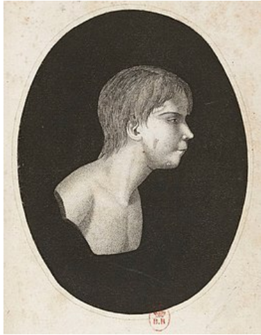
GRAVURE DE VICTOR DE L'AVEYRON